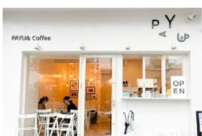
インドネシアコーヒーの専門店 PAYU&