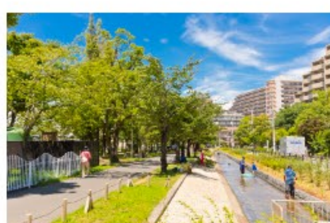
都内にいながら水と森の豊かな自然が感じられる親水公園 仙台堀川公園