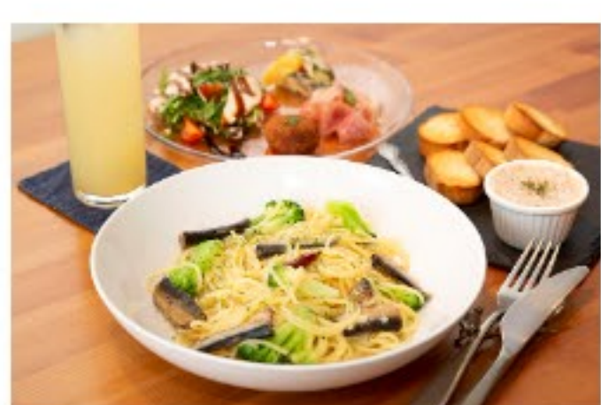
本格的なイタリア料理とワインが楽しめる ビノケン (Vinoken)