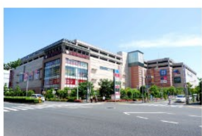
8つの大型店と約100の専門店が入る大型商業施設 南砂町ショッピングセンター-S UNAMO