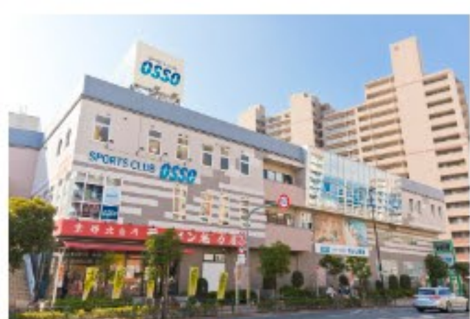
「美ボディメイク」を目指すフィットネススポーツクラブ osso(オッソ) 南砂店