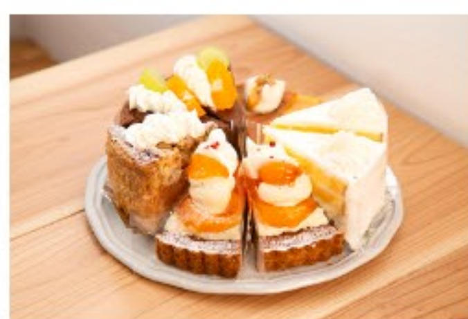
イタリア料理店の2階にある、パティシエが作るケーキが評判のお店 aoiケーキ店