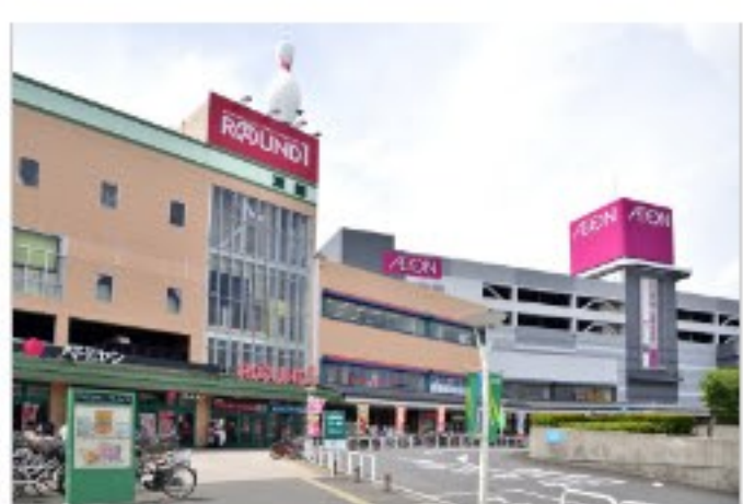
ファミリーで一日を楽しく過ごせる複合商業施設 トビレックプラザ