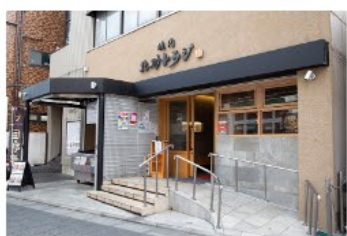
砂町銀座の人気焼肉店 焼肉北砂トラジ